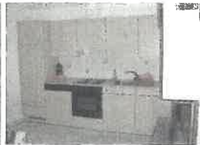
Grosse Küche mit Geschirrspüler