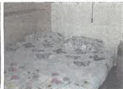
3 Schlafzimmer (je für 2 Personen) 1 Kinderbett