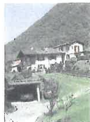
Den Gästen steht eine Garage mit Parkplatzmöglichkeit für zwei Autos zur Verfügung