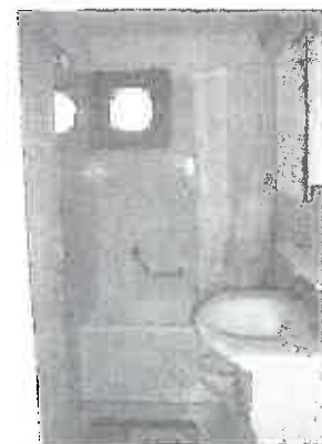
Badewanne und WC