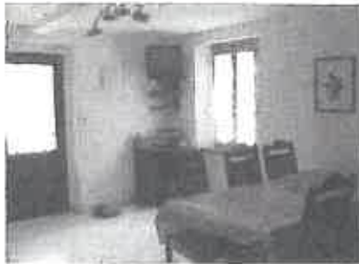
Wohnzimmer mit TV-Sat